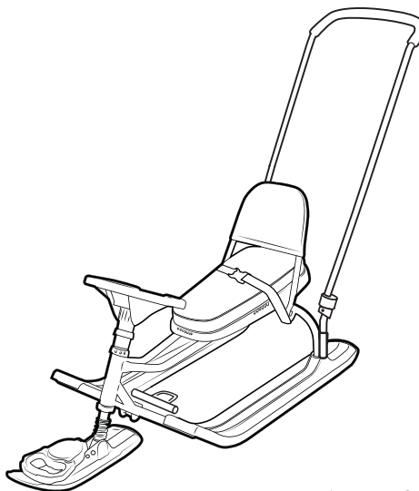
рис. 1 TWINY2+ (арт. TW2+)

ООО «Ника» 426052, Россия, Удмуртская Республика, г. Ижевск, ул. Лесозаводская, д. 23. тел.: (3412) 55-00-00, e-mail: info@nikaltd.ru www.nika-foryou.ru