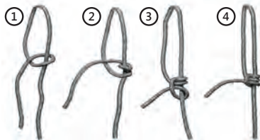
рис. 3 Схема завязывания узла на перемычке санок.

Внимание! Паспорт следует хранить в течение всего срока службы санок.