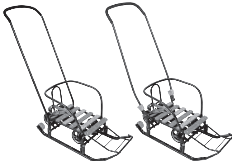
рис. 1 Санки арт. ТЗКУ